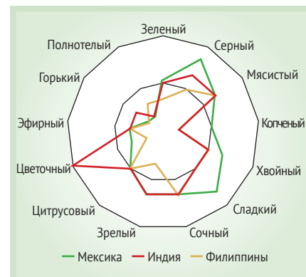
Рис. 1. Вкусовые профили ароматизатора со вкусом Манго, разработанных для Мексики, Индии и Филиппин

Технологи компании «Маком РУС» в условиях собственной лаборатории провели серию экспериментов по приготовлению различных напитков с использованием ароматизаторов Virginia Dare. Результаты тестирования ароматизаторов на четырех видах продуктов — коле, кофе «3 в 1»